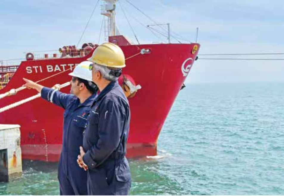
● أبناء "البتترول الوطنية" يعملون بروح الفريق الواحد لدفع الشركة من أجل تحقيق أعلى المكاسب