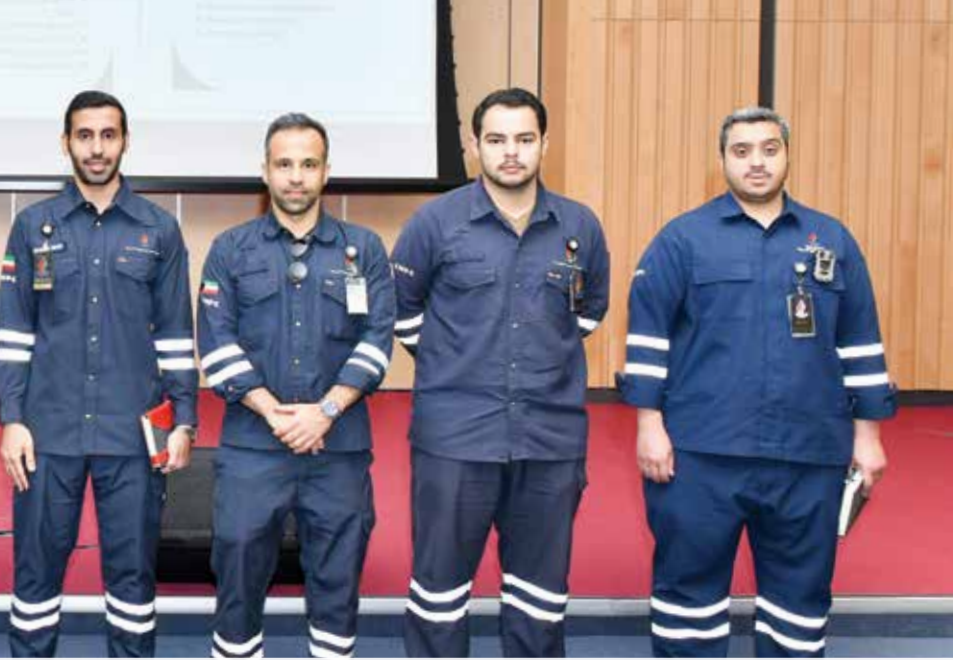
● قسم السلامة بمصفاة ميناء عبدالله قام بالترتيبات اللازمة لتنفيذ صيانة بعض الوحدات