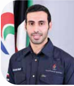
إعداد: عبدالله ماضي مهندس سلامة - مصفاة ميناء عبدالله

ترتيبات مُتعدّدة يتم اتخاذها قبل وأثناء وبعد عمليات الصيانة