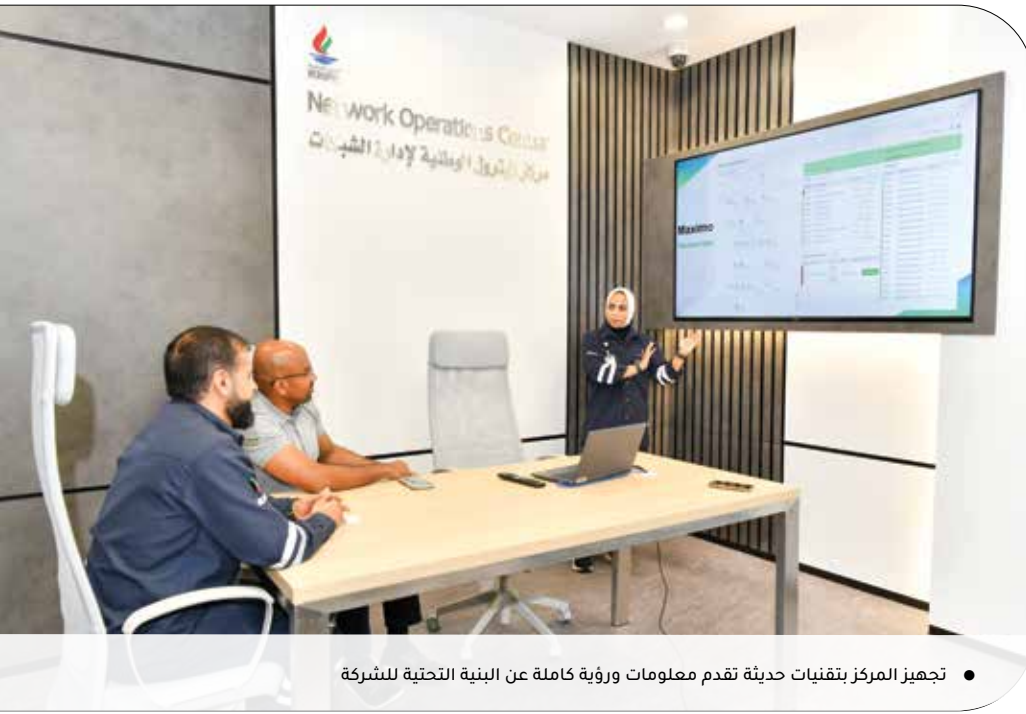
● تجهيز المركز بتقنيات حديثة تقدم معلومات ورؤية كاملة عن البنية التحتية للشركة