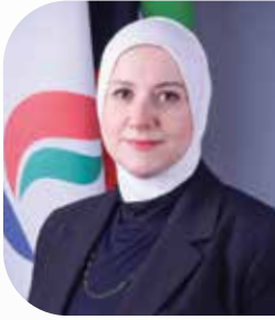
إعداد: د. هاجر بهزاد القسم الطبي - دائرة الصحة والسلامة والبيئة

يوضع تاريخ الصلاحية بناءً على اختبارات تتم في ظروف متنوعة