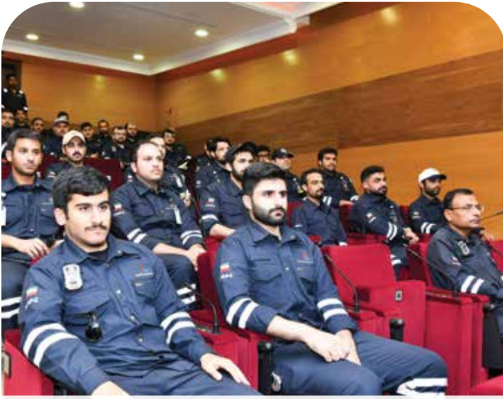
● العروض التعريفية هدفت إلى توضيح مسؤوليات الدوائر للمهندسين الجدد