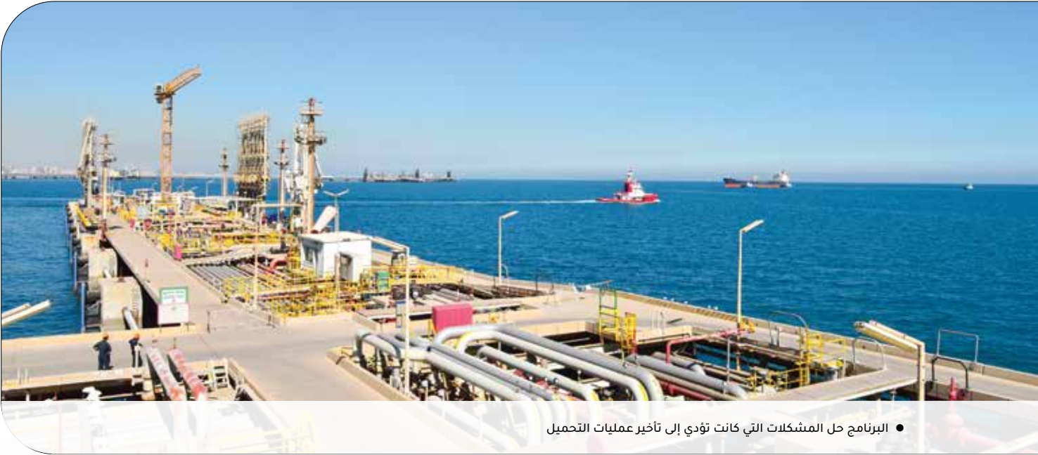
• البرنامج حل المشكلات التي كانت تؤدي إلى تأخير عمليات التحميل

اسم "برنامج متابعة حركة السفن" (Ship Tracking System - STS)، ومن خلاله تم تدارك الكثير من الأخطاء التي كانت تؤدي إلى تأخير التحميل، وبالتالي وقوع الغرامات.