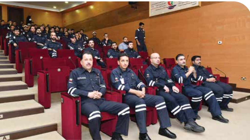
● دوائر وفرق مصفاة ميناء الأحمدى استعرضت مهامها وأدوارها