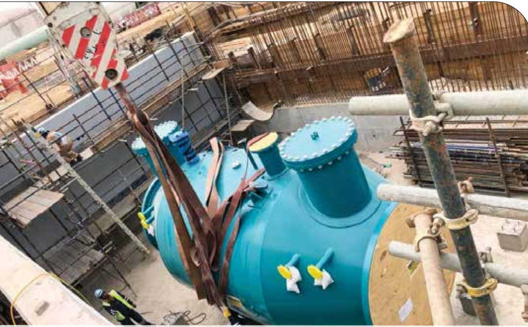
● الفلتر يستخدم تقنية الترشيح العكسي وإزالة الشوائب