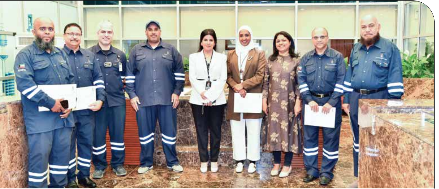
• نائب الرئيس التنفيذي للخدمات المساندة تتوسط المُكْرَمِينَ