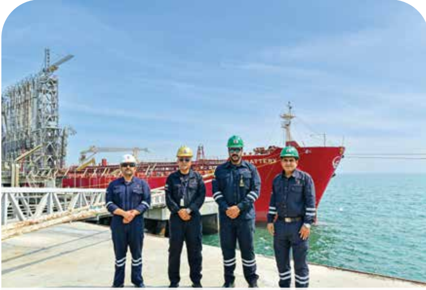
● الأفكار المبتكرة للعاملين في دائرة العمليات بمصفاة ميناء الأحمدى خفضت ساعات التأخير