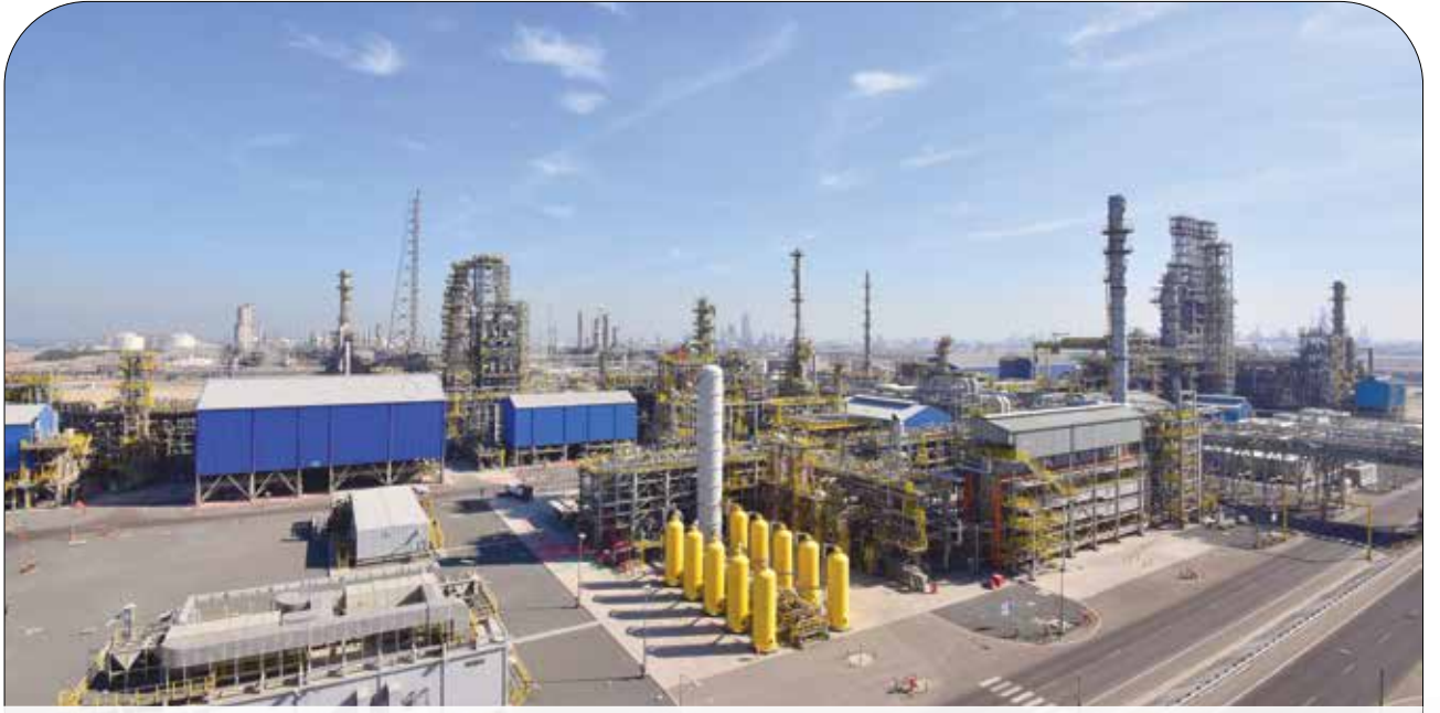
● مصفاة ميناء الأحمدى عززت موقعها في سوق تصدير المنتجات النفطية

إضافات تحسين التدفق ومكافحة ترسب الشمع (WAFI) من مُوردين مُختلفين لتحقيق الحد المستهدف لخواص تدفق الوقود البارد.