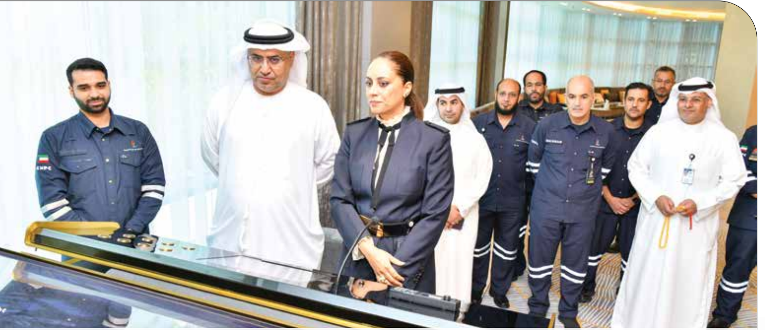
● الخطيب تُطلع السفير الإماراتي على المنصة الذكية لمشروع الوقود البيئي

العمل بالمصافي أهمية اتباع إرشادات الصحة والسلامة بكافة مواقع الشركة في جميع الأوقات، وذلك حفاظاً على أرواح الجميع وصحتهم.