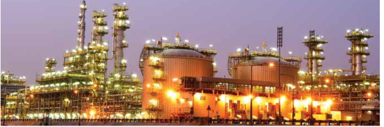
● قسم الكفاءة الصناعية يستهدف تحسين أداء العمل داخل مصفاة ميناء الأحمدية