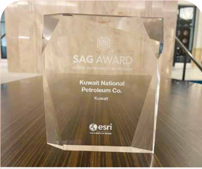
● الجائزة اعتراف بالتقدم الكبير للشركة في نظم المعلومات الجغرافية