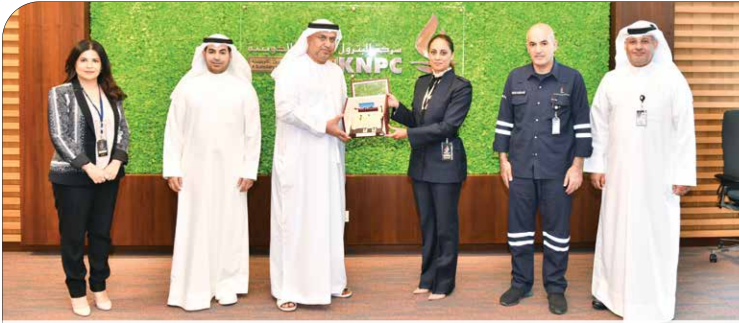
● السفير الإماراتي يهدي الخطيب مجسماً لـ "قصر الحصن"

الزائر الخريطة المتعلقة بمنتجات المصفاة التي تُظهر دورة كل مُنتج بداية من دخوله كـ "لقيم"، وحتى خروجه في شكل مُنتجات بترولية عالية الجودة قابلة للاستخدام في السوق المحلي، أو التصدير خارج البلاد.