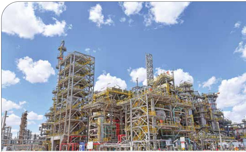
● استخدام الوحدة (رقم 144) في تجارب إنتاج الديزل المتوافق مع المواصفات الأوروبية